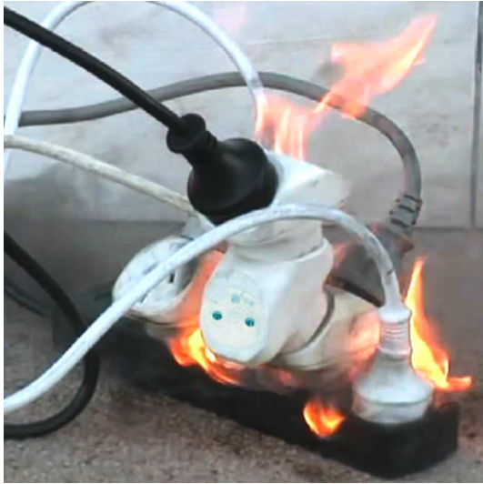
NO SOBRECARGUE LOS ENCHUFES