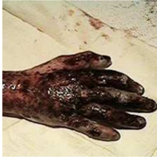
QUEMADO POR DESCARGA ELECTRICA

Además de ser la causa de una gran parte de los incendios, la electricidad hiere y mata a miles de personas cada año ¡¡NO SE LA JUEGE CON LA ELECTRICIDAD!!